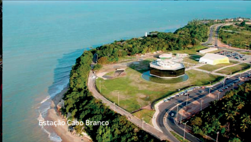
Estação Cabo Branco