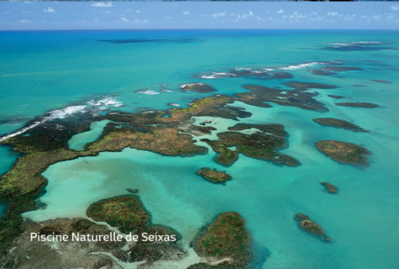
Piscine Naturelle de Seixas